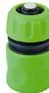
ENGATE RAPIDO VIQUA