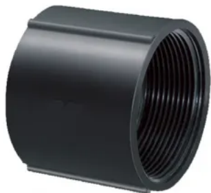
LUVA PARA ELETRODUTO ROSCAVÉL