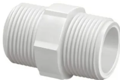
NIPEL ROSCAVEL BRANCO